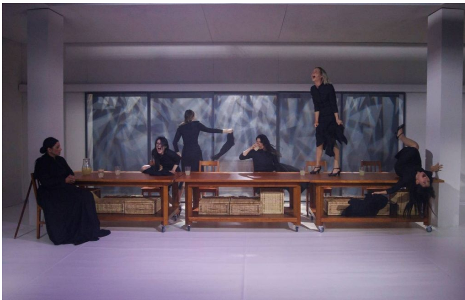
Casa Bernardei Alba.

(socială și sexuală). Văduva Bernarda conduce lupta de dominare a erotismului debordant al celor cinci fiice, cu vârste între 20 și 39 de ani, între care există o ierarhie socială, legată de găsirea unui pretendent, dar și o ierarhie pasională, a impusului erotic. Doar fiica cea mare are dota – din moștenirea tatălui și primului soț al Bernardei – care să o îndreptățească la căsătoria eliberatoare și, de aceea, disperarea surorilor crește cu scăderea vârstei. Femeile sunt victimele cutumelor sociale, al căror apărător și garant este mama. Muzica joacă în spectacol rolul comentariului din off și portavocea manifestului luptei pentru libertate. Melodia pe care o ascultă la radio și, apoi, o cântă fiicele Bernardei, You Don't Own Me (Lesley Gore) din 1964, sugerează racordul la eliberarea sexuală a generației X și leagă două epoci prin strategia autodeterminării cucerite prin încălcarea restricțiilor, cu orice preț.