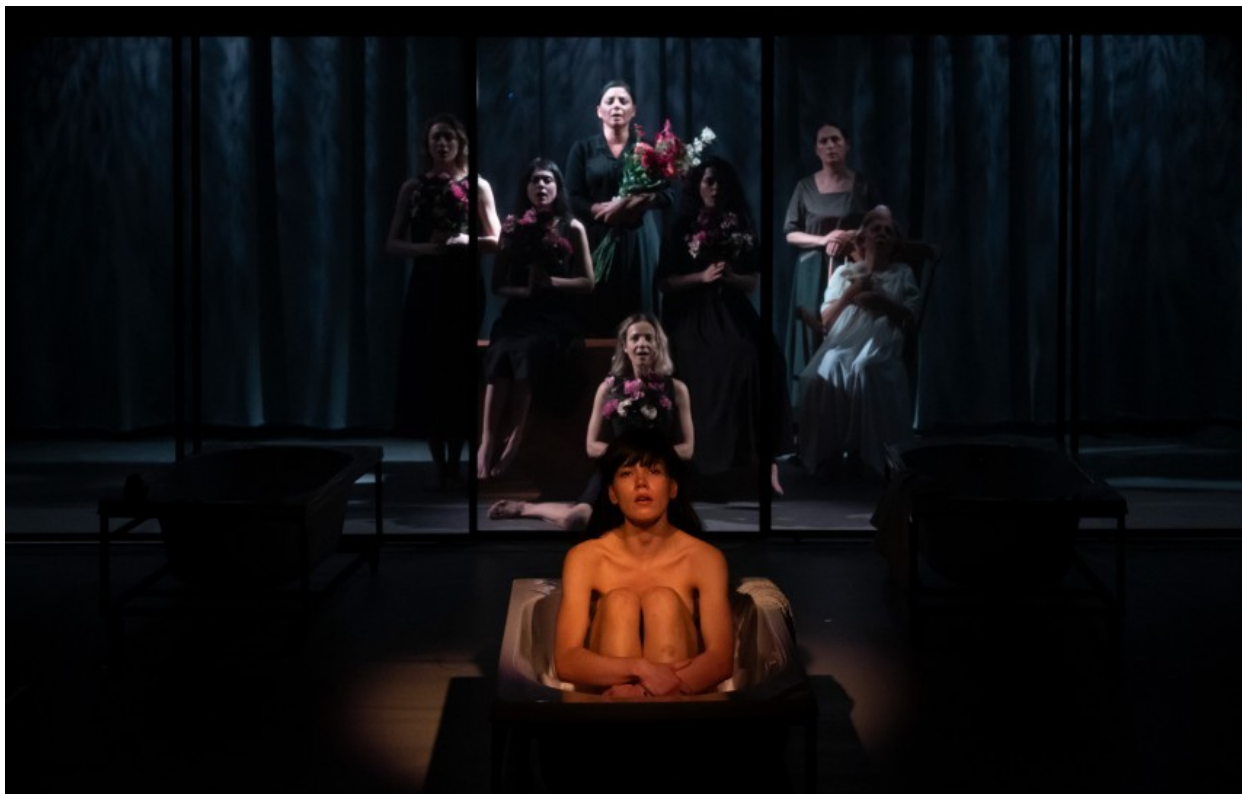
Casa Bernardei Alba

P.S. 2024 a fost anul fetelor. Anul fetelor-contradicție și al actrițelor revelație. Privit panoramic, dintr-un unghi reflexiv-subiectiv, 2024 a fost un an al performanțelor actoricești feminine. Un an teatral care a adus pe scenele din țară sondări profunde și neașteptate ale feminității, căutări artistice articulate curajos dincolo de stratul epidermic al reprezentării personajelor feminine. Fără pretenția exhaustivității sau a ierarhizării, păstrând drept principiu ordonator criteriul calității artistice, țin să închei prin a aminti, câteva spectacole (pe lângă „Casa Bernardei Alba” de la Teatrul de Stat Constanța) devenite, în conștiința mea, repere pentru acest 2024 al fetelor :