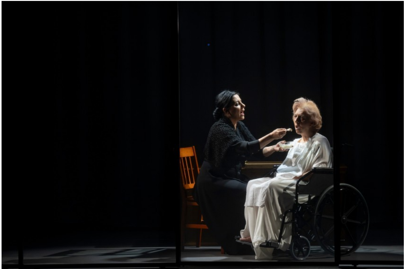
Casa Bernardei Alba