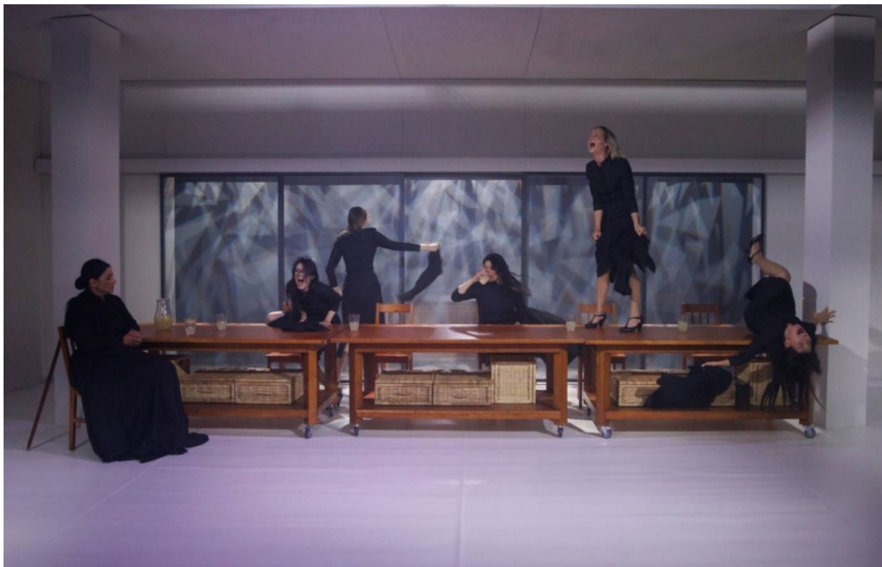
Casa Bernardei Alba

Fără a pierde nicio secundă din vedere racordurile frisonante cu realitatea imediată, spectacolul de la Constanța frapează printr-o simplitate dezarmantă, prin acel less is more care naște zone vitale de ambiguitate și interpretări multiple, dar mai ales prin încrederea deplină a regizoarei în piesa și în distribuția alese. O încredere rară pe scenele din țară, care abundă în spectacole născute strâmb din neîncredere și orgoliu regizoral, încărcate până la refuz și asfixiate de nenecesar. O încredere rară, care se traduce pe scenă în lipsa oricăror artificii regizorale care să distragă atenția de la esența textului. O încredere care răzbate dincolo de spectacolul propriu-zis, pe care o intuiesc a fi parte esențială din procesul de lucru și din atmosfera repetițiilor, o încredere care spune multe despre abilitatea regizoarei de a înțelege și de a coagula energiile echipei de creație.