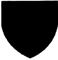
CONSILIUL JUDEȚEAN CONSTANȚA