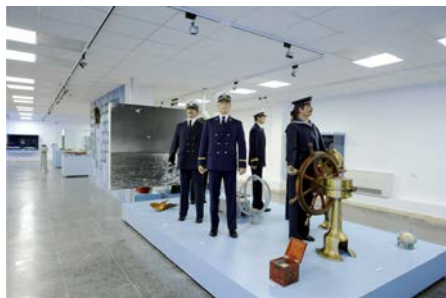
Marinari în uniformă

Evoluția navigației în antichitate este ilustrată cu ajutorul unor hărți în piatra, mulaje de pe Columna lui Traian, machete de corăbii grecești și romane, ancore originale, amfore. Mai sunt prezentați luptători daci și romani în mărime naturală sub forma unor manechine foarte bine executate.