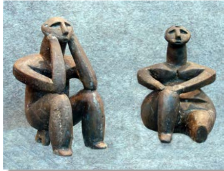
Gânditorul de la Hamangia

Etajul II al muzeului cuprinde o înălțuire de imagini și obiecte începând cu perioada secolului al XVIII-lea până în perioada modernă a existenței regiunii Dobrogea. Sunt prezentate momentele revoluției de la 1821 conduse de Tudor Vladimirescu, revoluției de la 1848, unirii Principatelor Române din 1859 sub Alexandru Ioan Cuza, războiului de independență din 1877, primului război mondial, etc. Sala XVI este dedicată evenimentului de excepție al desăvârșirii unității naționale de la 1 decembrie 1918.