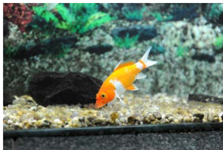
Crap de cultură ornamentală