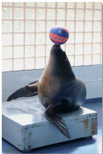
Foca - Otaria Byronia

Organizarea de simpozioane, sesiuni de comunicări științifice, cu specialiști din țară și din străinătate, contribuie la menținerea actuală a nivelului de cunoștințe de specialitate.