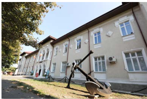
Clădirea Muzeului Marinei

Muzeul mai conține colecții de ancore și timone. Sunt expuse ancore din lemn, fier și oțel. Cea mai veche timonă din muzeu este cea de pe Cruciașătorul “Elisabeta”, construit în Anglia în anul 1888.