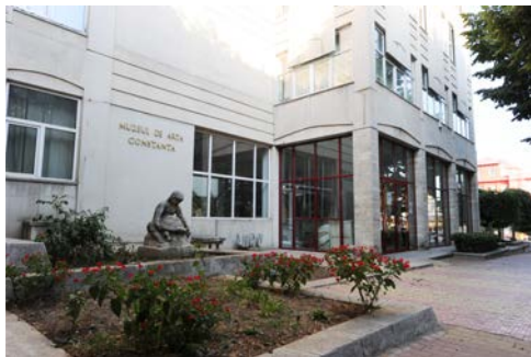
Muzeul de Artă Constanța

Situat la țărm de mare, într-unul dintre marile porturi europene, Constanța, Muzeul de Artă este considerat pe plan național un important și reprezentativ spațiu de păstrare și valorificare a creației plastice românești din perioadele modernă și contemporană.