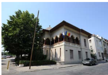
Muzeul Ion Jalea

Originar din Dobrogea, marele maestru al sculpturii românești, Ion Jalea (1887 - 1983), a cărui activitate artistică a străbătut peste șapte decenii, a donat în anul 1968 orașului de care era atât de legat spiritual și mai ales afectiv, un număr de 108 lucrări ce constituie actuala colecție.