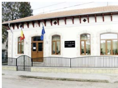
Muzeul "Dinu și Sevasta Vintilă"