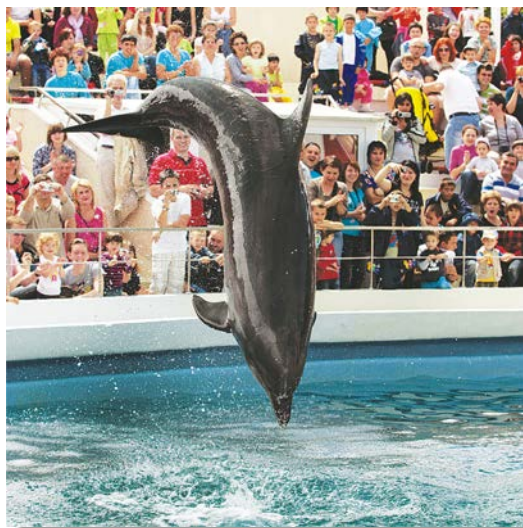
Delfin din Marea Neagra