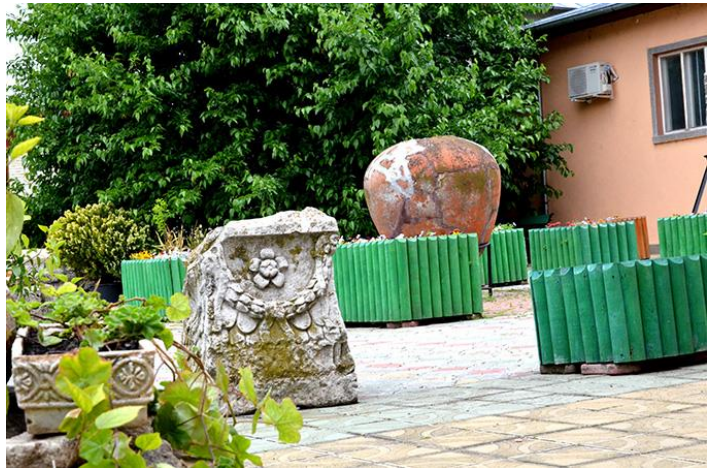
Muzeul de Istorie și Arheologie Axiopolis

Celelalte săli sunt destinate epocii metalelor și perioadei romane în raport cu fortificațiile de pe linia Dunării.