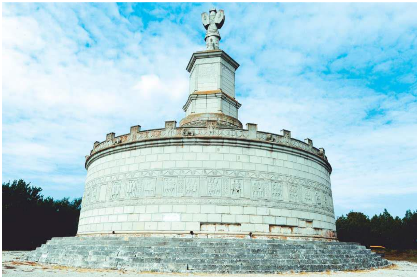
Monumentul Tropaeum Traiani Autor: Consiliul Județean Constanța

Descriere: Monumentul, conceput ca simbol al forței Romei, a fost ridicat de Împăratul Traian în urma unor importante victorii repurtate în aceste locuri în primul război dacic. Monumentul triumfal, închinat Zeului Marte Răzbunătorul (Mars Ultor) a fost ridicat între anii 106-109 p.Chr., la sfârșitul războaielor dacice.