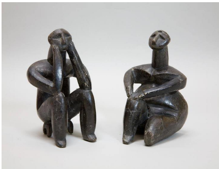
Grupul statuar „Gânditorul de la Hamangia” și „Femeie șezând”

În mai puțin de cinci ani de la descoperire, statuetele au devenit celebre în toată lumea și au ajuns să fie expuse în străinătate. Au ajuns la Paris, la Londra, la New York sau la Atena.