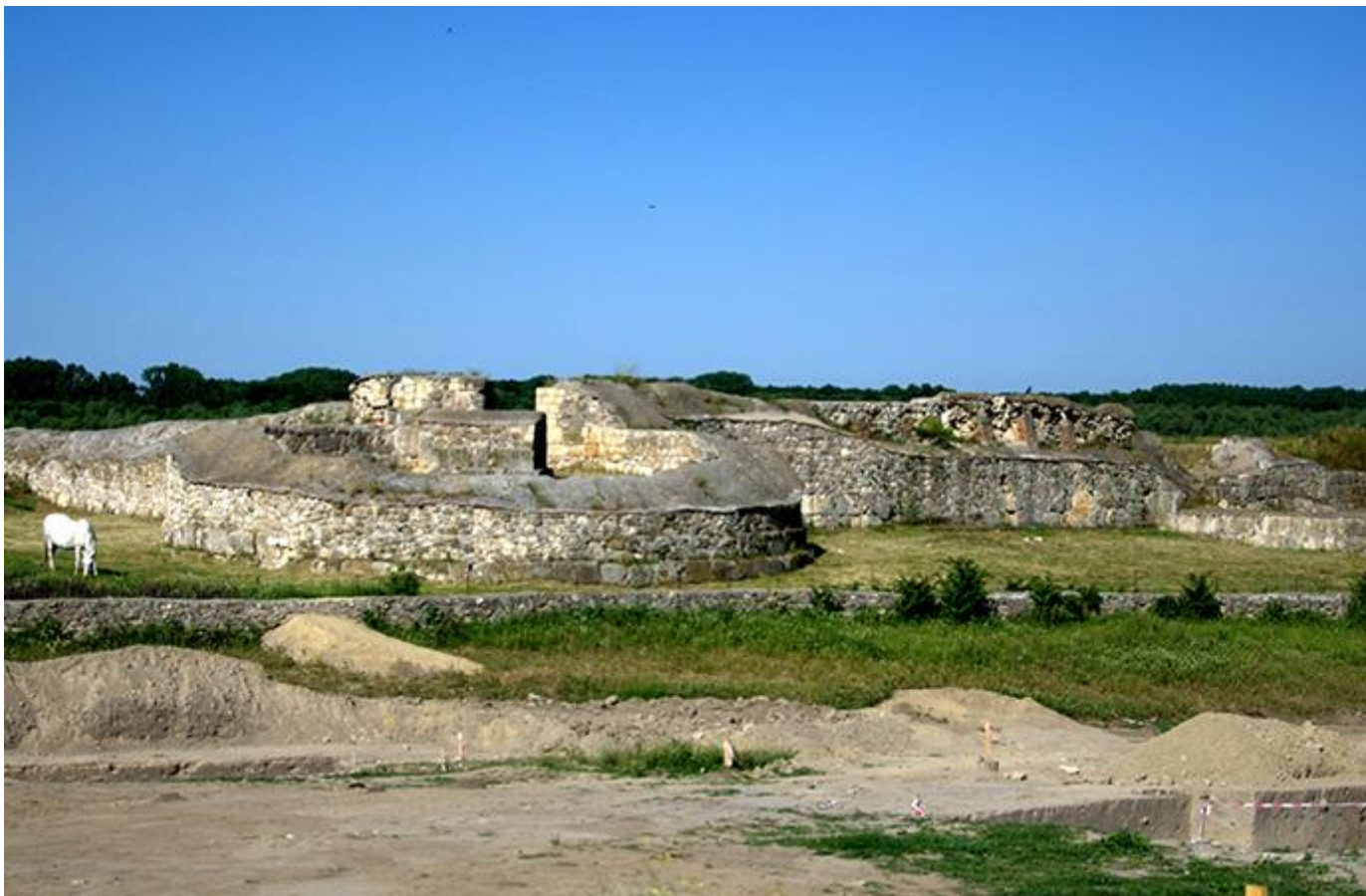
Ruinele Cetății Capidava

Tabula Peutingeriana ne oferă date exacte privind distanțele dintre Axiopolis, Capidava și Carsium. Aceste distanțe coincid cu distanțele dintre localitățile actuale Hinog - Capidava și Capidava - Hârșova. În verificarea tablei vine descoperirea unui stâlp miliar în localitatea Seimenii Mici care dă distanța de 18000 de pași de la Axiopolis la Capidava, adică 27 de km.