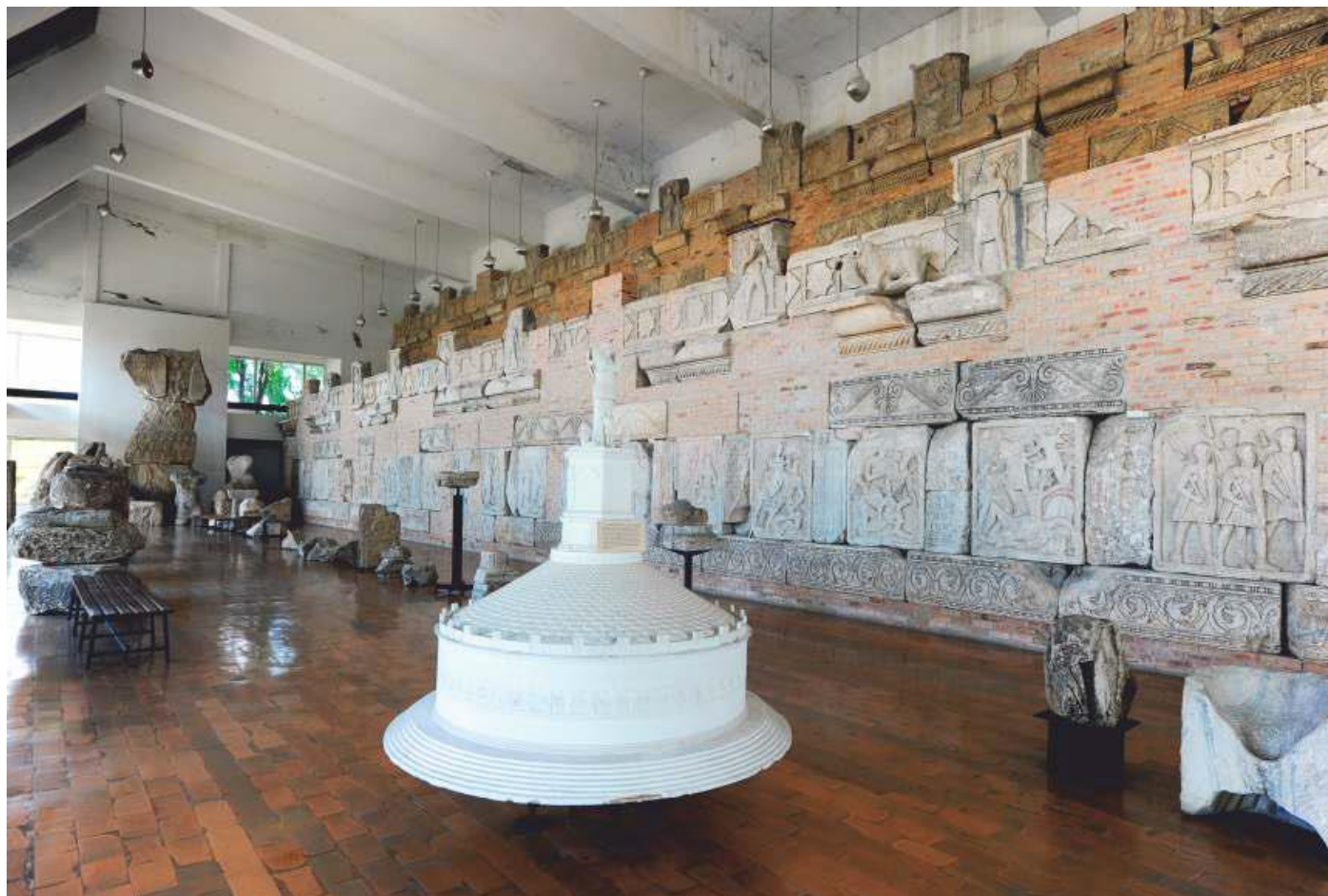
Muzeul Tropaeum Traiani

Sunt prezente colecții ceramice, colecții-piese de arhitectură, colecții-podoabe etc. De asemenea, sunt expuse metope, friza inferioară și cea superioară, pilaștrii, crenelurile și blocurile de parapet ale atticului festonat, statuia colosală a trofeului, inscripția și friza cu arme, resturi ale pereților altarului cenotaf, fragmente din soclul statuii trofeului pe care sunt sculptate chipul meduzei și cnemide, un suport de solz, un solz de la acoperișul tronconic.