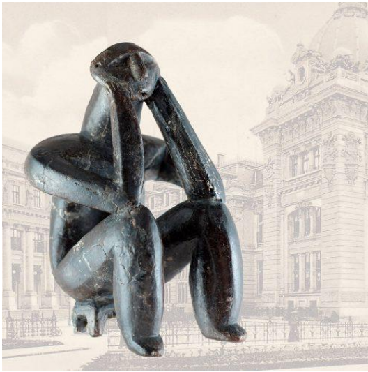
„Gânditorul de la Hamangia”

Autor: Muzeul Național de Istorie a României