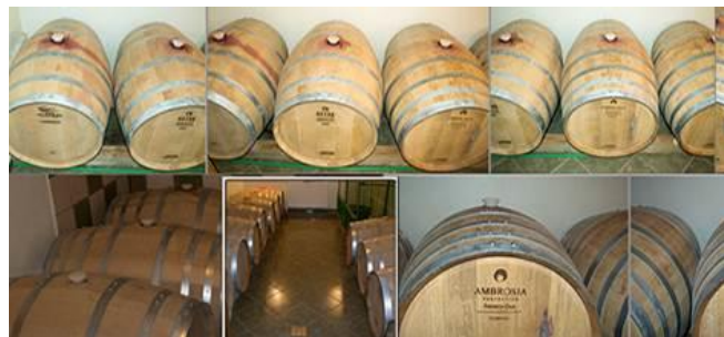
Crama Darie - Procesul de vinificație

Descriere: Anul înființării: 2006; Număr de hectare: 30 ha; Soiuri de struguri: Chardonnay, Fetească Neagră, Merlot.