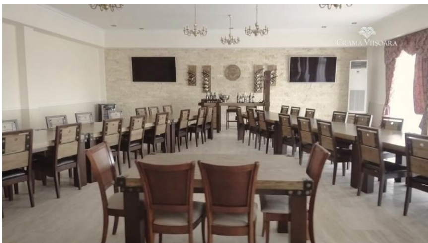
Sala de degustări - Crama Viișoara