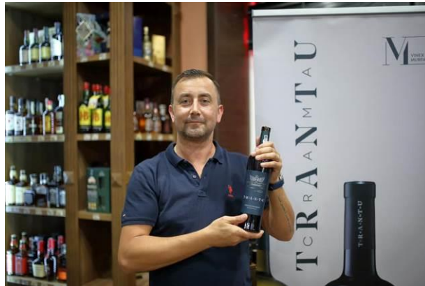
Magazin Crama Trantu

Investițiile permanente în tehnologie, oamenii și eticheta asigură premisele dezvoltării de produse premium, încununarea eforturilor continue de păstrare și transmitere a unei tradiții locale, vechi de 2000 de ani.