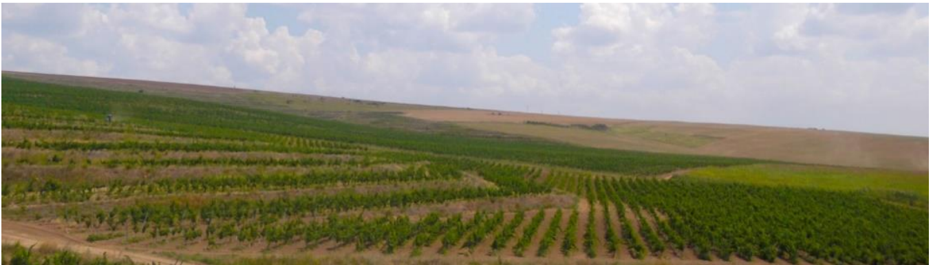
Domeniile Adamclisi - Podgoria

Adamclisi este așezat în sudul Dobrogei, străvechi pământ românesc. Localitatea este străjuită precum o fortăreață de brațul vânos al fluviului Dunărea, semetul canal Dunăre-Marea Neagră și nemărginita Mare Neagră.