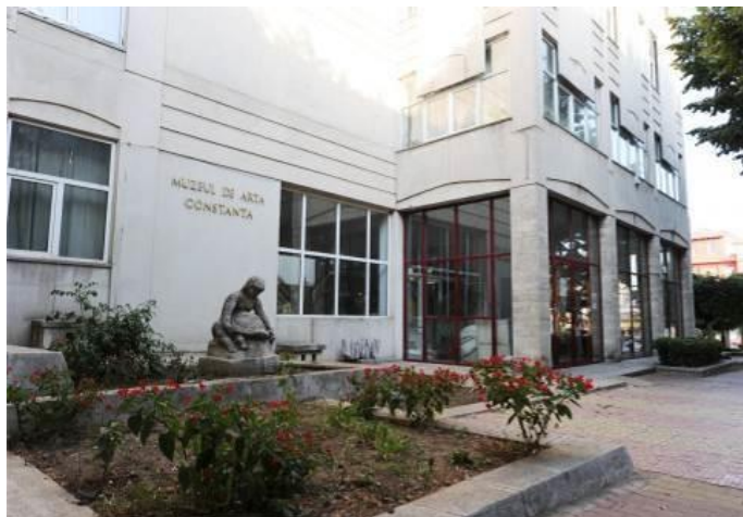
Muzeul de Artă Constanța

De-a lungul deceniilor sale de existență muzeul a editat cataloage de expoziții, studii și cărți de specialitate, cercetări de antropologie culturală și urbană, axate pe problematici specifice artei moderne și spațiului dobrogean.