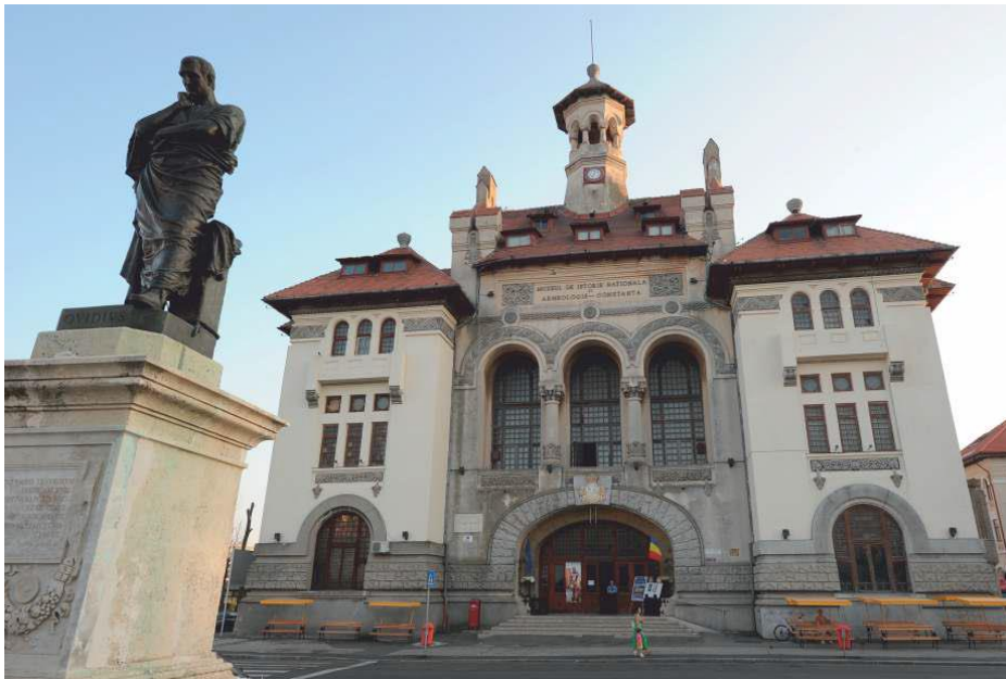
Muzeul de Istorie Națională și Arheologie Constanța