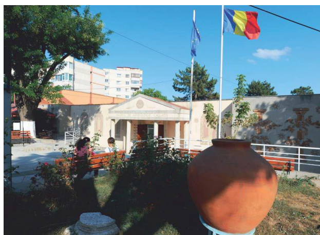
Muzeul de Arheologie „Callatis”

La aproximativ 50 de metri de muzeu, către centrul orașului, se află expuse, în parcul arheologic municipal, alte coloane antice și diverse fragmente arhitectonice, precum și sarcofage din perioada romană.