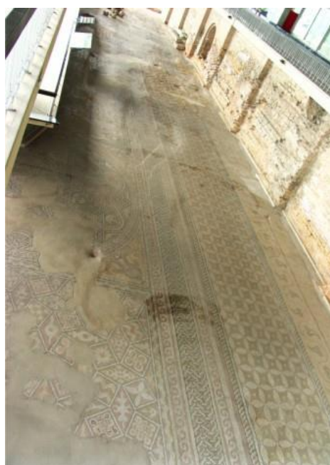
Detaliu paviment (mozaic) - Edificiul roman cu mozaic