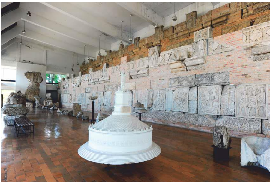
Muzeul Tropaeum Traiani

Descriere: Clădirea a fost inaugurată în 1977 și cuprinde vestigii arheologice descoperite în urma cercetărilor arheologice și a descoperirilor fortuite în cetatea Tropaeum Traiani, la monument (piesele originale) și în vecinătatea imediată sau mai îndepărtată.