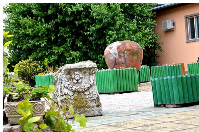
Muzeul de Istorie și Arheologie Axiopolis

Dovadă a prezenței unor mari legiuni romane (XIII Gemina, XI Claudia, I Italica) sunt cărămizile de lut și țiglele de lut cu ștampilele acestor legiuni, găsite în Dobrogea.