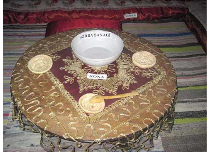
Casa Tătarească „Zulfie Totay” - Cobadin