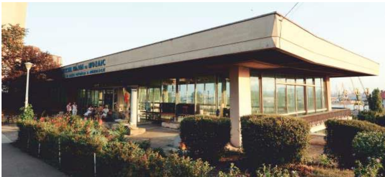
Edificiul roman cu mozaic

Prima terasă este situată la nivelul actual al Pieței Ovidiu și asigură legătura cu una dintre piețele publice ale orașului antic. Următoarele două terase corespund corpului principal al edificiului, de forma unui trapez alungit, dezvoltat pe două nivele - cel superior fiind reprezentat de sala cu pavimentul de mozaic, iar cel inferior de o serie de 11 încăperi boltite folosite ca magazii-depozite pentru mărfuri. Ultima terasă este situată la nivelul cheiurilor portului antic și cuprindea încă o serie de magazii boltite, acoperite astăzi de nivelul modern de călcare.