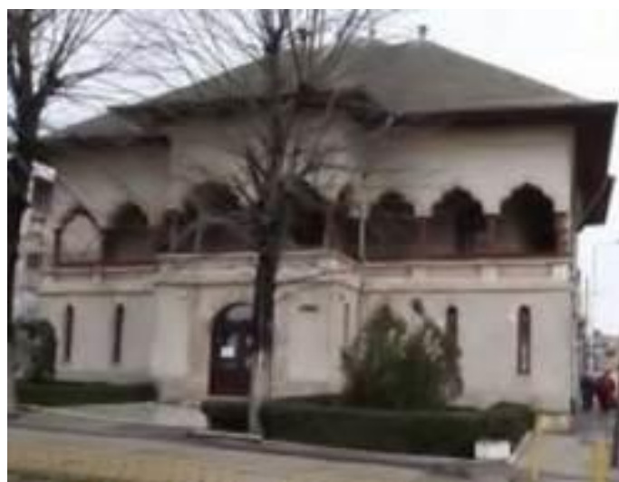
Muzeul de Sculptură „Ion Jalea”