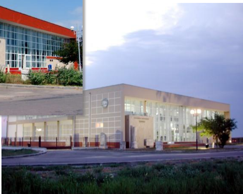
Muzeul Cetății Histria