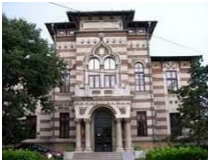
Muzeul de Artă Populară Constanța