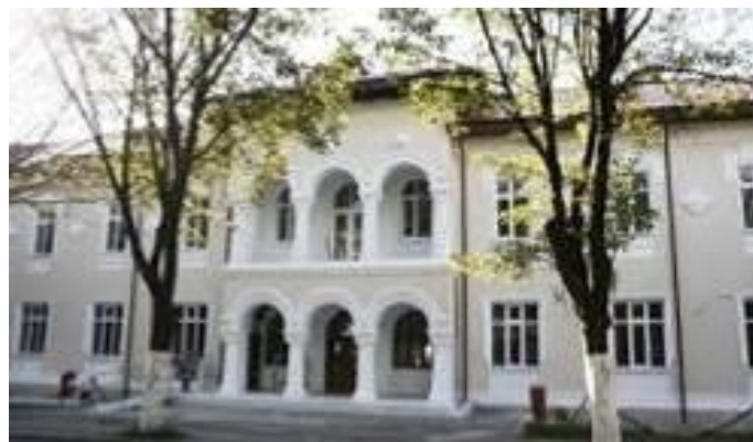
Muzeul Marinei Române

Exponatele și fondul său documentar au inspirat cercetătorilor, istoricilor, muzeografilor, artiștilor și personalului de specialitate propriu, din instituțiile militare de învățământ ale Marinei, ca și din alte instituții de profil și centre de cultură din armată și societatea civilă, pagini inedite de istorie navală și militară, precum și lucrări de certă valoare artistică și științifică.