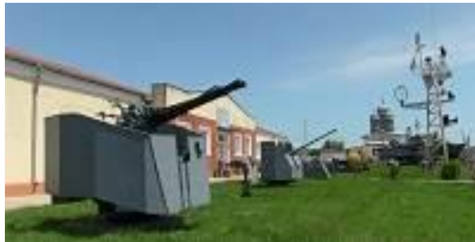
Muzeul Marinei Române Mangalia Autor: Consiliul Județean Constanța

În curtea din fața clădirii muzeale sunt expuse piese dintr-o impresionantă colecție de artilerie navală și antiaeriană, dominată de masivul tun de 130 mm, care aparține artileriei de coastă.