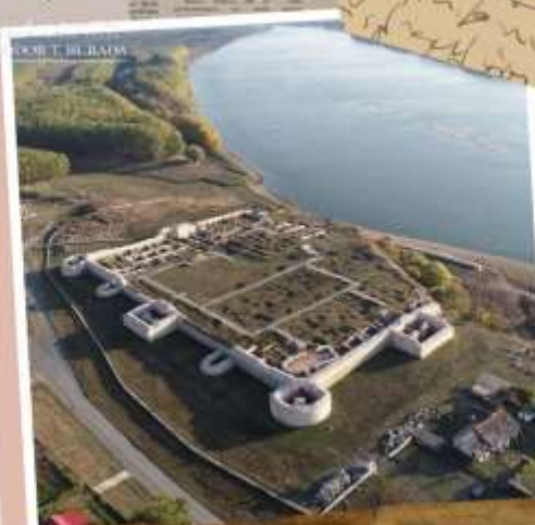
ILIE SCOB T. DE BAIAM