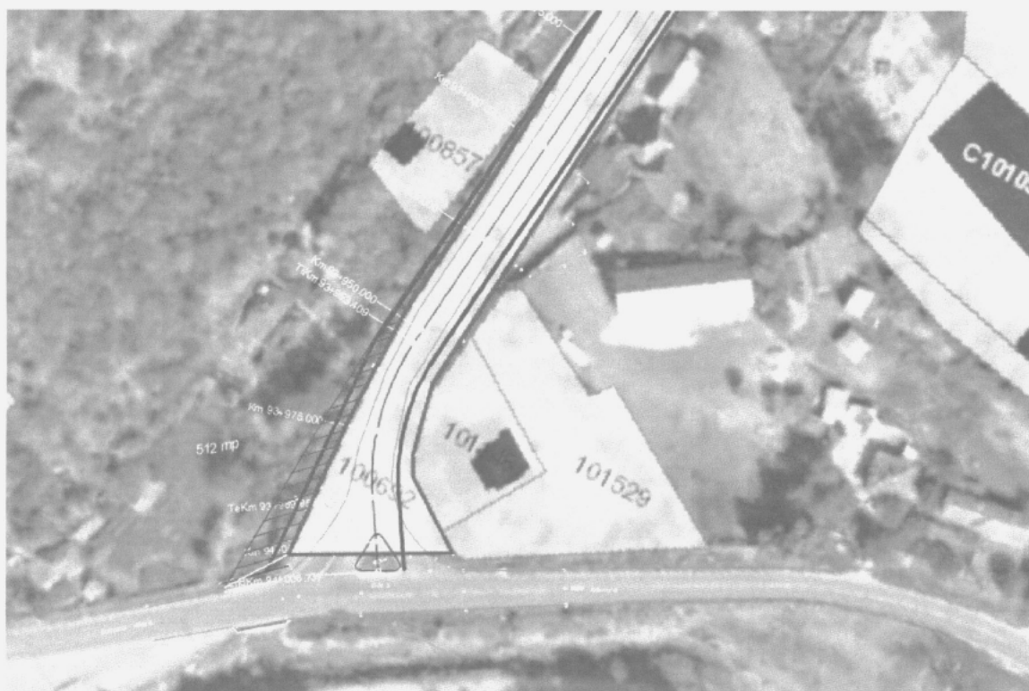
Loc. Ion Corvin, Comuna Ion Corvin, Județul Constanța - Suprafața = 512 mp