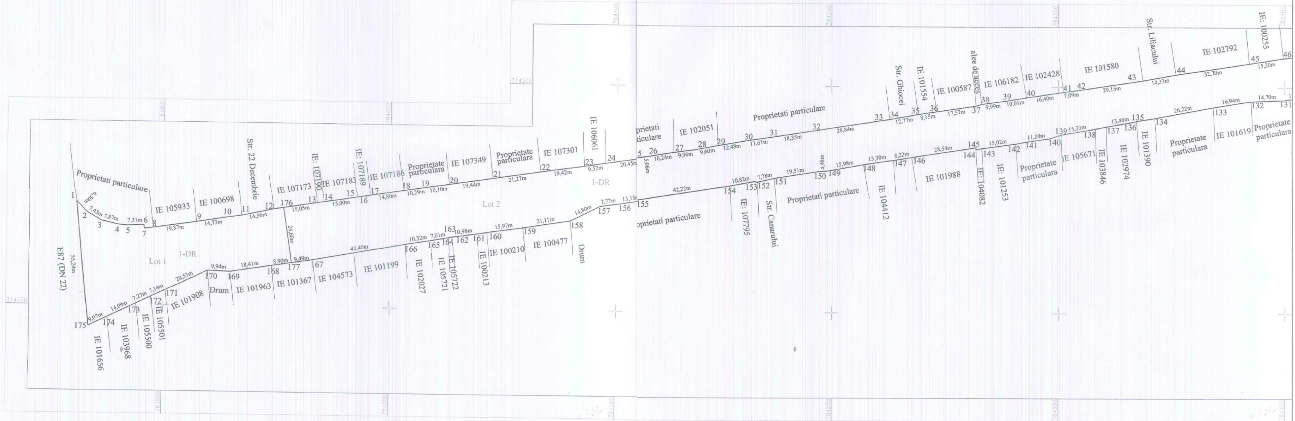
Tabel de miscare parcelara pentru dezlipire imobil