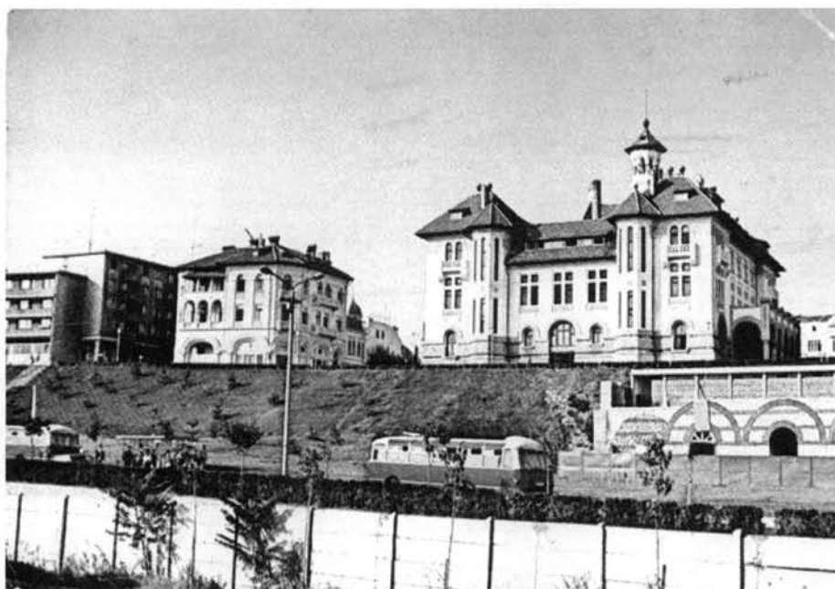
Fig. 3 – Cladirea Primariei si Edificiul Roman cu Mozaic 1960-1970