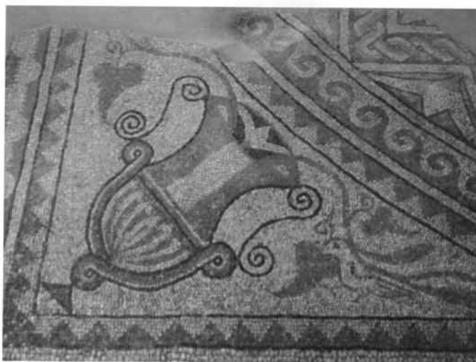
Fig. 6 – Kantharos stilizat si porumbelul alb

Cercul din patratul sud-vestic este inscris unui patrat a carui latura este un chenar policrom, lat de 11cm. In acest chenar ingust apar tesserae verzi-albastrui si caramizii, intre coltul de nord-est al covorului si pana la circumferinta cercului, intreaga suprafata este ocupata de imaginea unui kantharos. Inaltimea acestuia este de 0,95 m, iar latimea, masurata la toarte, este de 0,85m. Culorile in care s-a realizat sunt armonios imbinat. Langa toarta din dreapta (sud-vest) apare imaginea unui porumbel – singura imagine zoomorfa de pe intreaga intindere conservata a pavimentului de mozaic (Fig. 6).