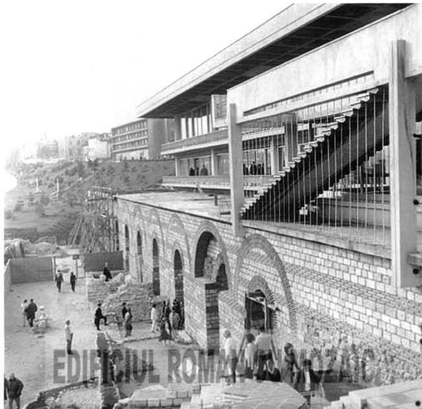
Fig. 2 – Zidul antic al boltilor refacut si cladirea de protectie

În 1959, pe faleza de vest, în spatele pieții Ovidiu, s-au descoperit, cu prilejul construirii unui bloc de locuințe și a unui bulevard, la 8 metri adâncime, mai multe ziduri antice și un fragment de mozaic bine conservat. Săpăturile arheologice desfășurate în perioada 1959-1965 au scos la iveală monumente aflate la 10-20 de metri sub dărămături și moloz, iar cele dintre 1965-1968, anexele sud-estice și termele ce făceau parte, se pare din același complex. Mozaicul descoperit atestă viața economico-socială și comercială a metropolei tomitane în prima jumătate a sec IV, în epoca lui Constantin cel Mare.