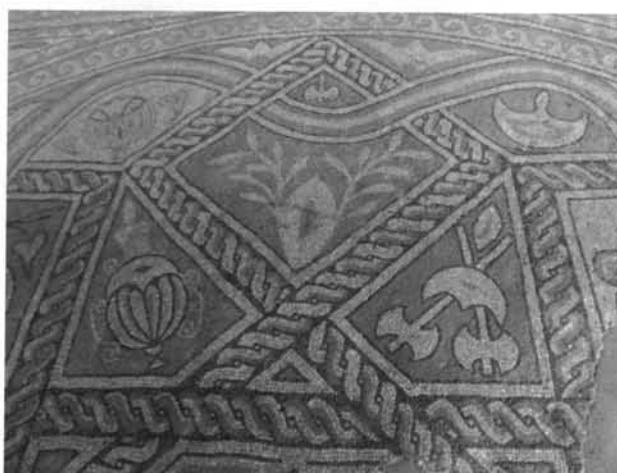
Fig 7 – Motive din primul cerc al mozaicului

Cel de-al doilea cerc (Fig. 8), pastrat in mica parte, ar fi plasat chiar in centrul edificiului. De remarcat ca solzii descresc de la circumferinta spre centrul cercului, fara sa stim sau sa putem reconstitui exact cum arata acesta. Fiecare solz are un contur stilizat, realizat tot in 2-3 randuri de tesserae divers colorate.