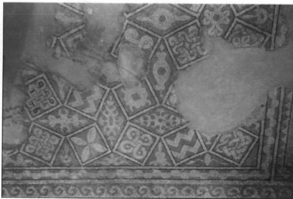
Fig. 9 – Campul despartitor pastrat pe covorul cu mozaic

Toata partea dinspre nord-vest a covorului cu mozaic a fost refacuta la o anumita epoca, necunoscuta. Culorile se schimba – in special in chenarul cu vrej de iedera si cercuri intersectate – linia figurilor este mai neglijat, stilizarea neingrijita.