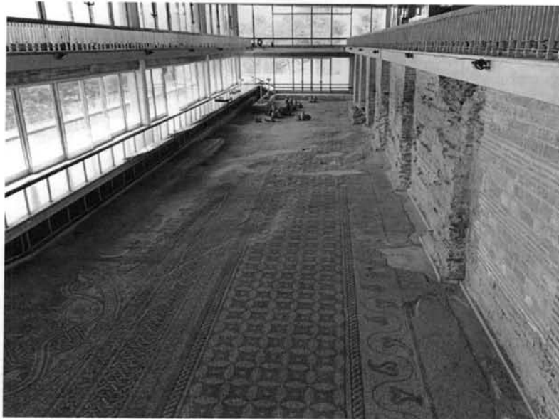
Fig. 4 – Covorul cu mozaic si zidul antic

Mai in detaliu, mozaicul se poate descrie astfel: