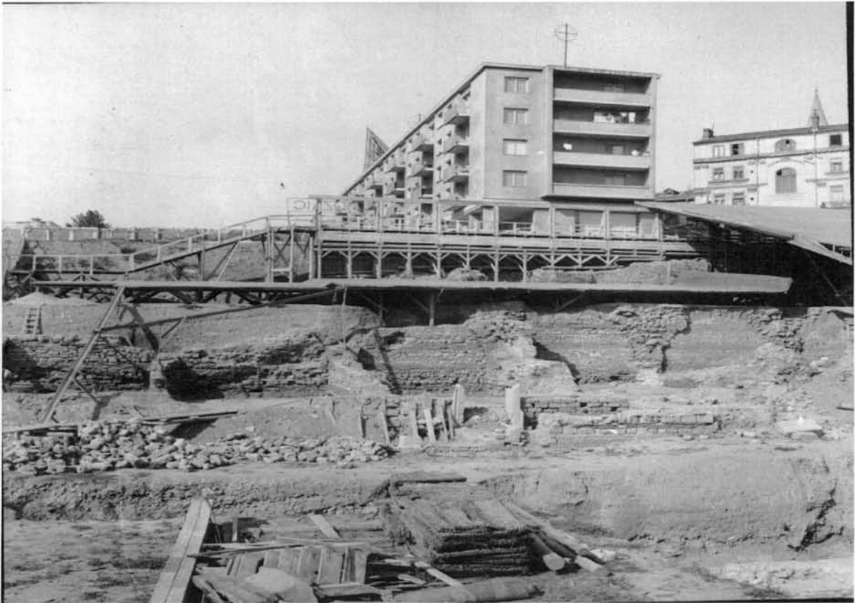
Fig. 1 – Cercetare arheologica 1959-1960

În 1959, pe faleza de vest, în spatele pieții Ovidiu, s-au descoperit, cu prilejul construirii unui bloc de locuințe și a unui bulevard, la 8 metri adâncime, mai multe ziduri antice și un fragment de mozaic bine conservat. Săpăturile arheologice desfășurate în perioada 1959-1965 au scos la iveală monumente aflate la 10-20 de metri sub dărămături și moloz, iar cele dintre 1965-1968, anexele sud-estice și termele ce făceau parte, se pare din același complex. Mozaicul descoperit atestă viața economico-socială și comercială a metropolei tomitane în prima jumătate a sec IV, în epoca lui Constantin cel Mare.