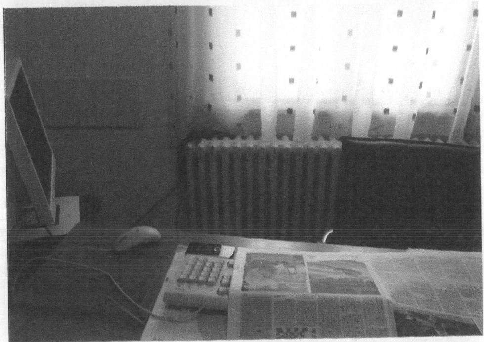
CALORIFER FORTA TIP UCRAINA